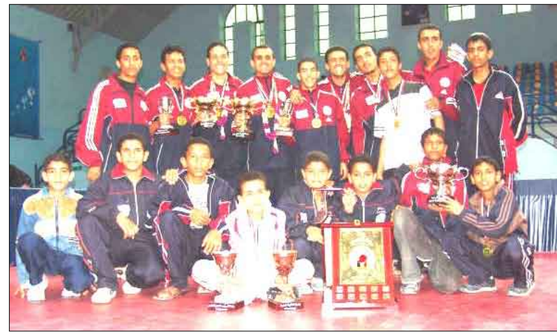
اهلي صنعاء لكرة الطاولة من الأرشيف.